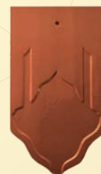
สีน้ำตาลรัศมี