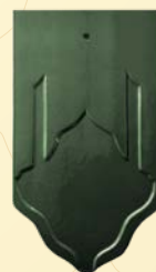
สีเขียวมรกต