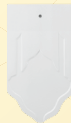
สีขาวพรวนกา