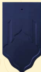
สีน้ำเงินไพฑูริย์