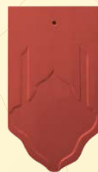
สีแดงจิดจรัส

ขนาด : กว้าง 16.5 ซม. ยาว 27.5 ซม. หน้า 1 ซม. น้ำหนัก : 0.85 กก. / แผ่น จำนวนแผ่น / ตร.ม. : 60 แผ่น