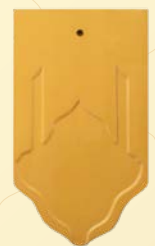
สีเหลืองทึบ